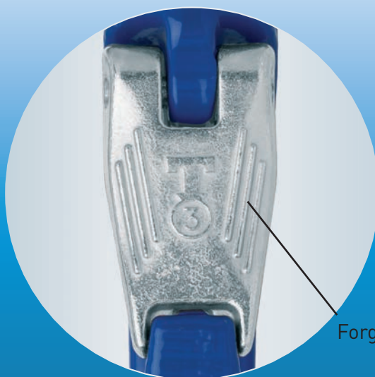
Forged Safety Latch

THIELE GmbH & Co. KG Werkstr. 3 · 58640 Iserlohn · Germany THIELE.de · hebetechnik@THIELE.de